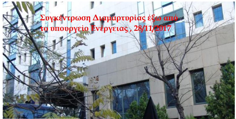
Συγκέντρωση Διαμαρτυρίας έξω από το υπουργείο Ενέργειας, 28/11/2017