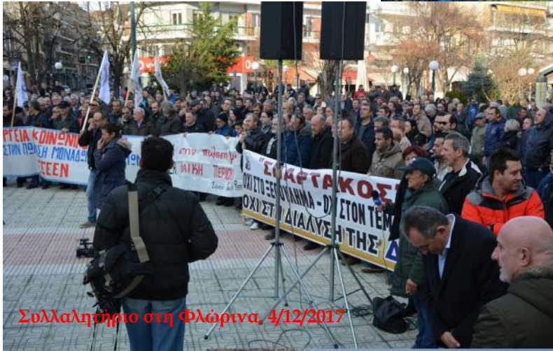
Συλλαλητήριο στη Φλώρινα, 4/12/2017