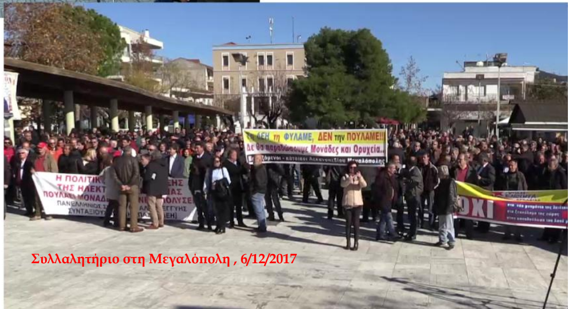
Συλλαλητήριο στη Μεγαλόπολη, 6/12/2017