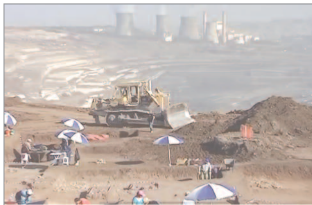
Σωστική ανασκαφή στην περιοχή Λιβάδι Μαυροπηγής

Ε ναν από τους παλαιότερους οικισμούς της Ευρώπης έκρυβε η γη της Πτολεμαΐδας. Χάρη στην ερευνητική Λ΄ Εφορείας Προϊστορικών και Κλασικών Αρχαιοτήτων και το Λιγνιτικό Κέντρο της Δυτικής Μακεδονίας, που χρηματοδοτεί τις αρχαιολογικές ανασκαφές, μπορούμε να μάθουμε την ιστορία του τόπου μας, όπως την «ξαναγράφουν» οι αρχαιολόγοι αξιοποιώντας τα νέα ευρήματα.