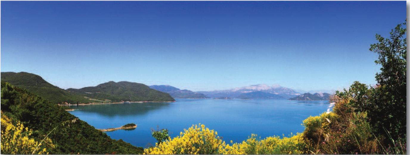
ΥΗΣ Κρεμαστών, τεχνητή λίμνη

Σ τρατηγικός στόχος της ΔΕΗ είναι να εξασφαλίσει τη βιώσιμη λειτουργία και ανάπτυξη της, παρέχοντας στους πελάτες της ολοκληρωμένες, καινοτόμες και υψηλής ποιότητας υπηρεσίες και προϊόντα, στους εργαζομένους άριστο εργασιακό περιβάλλον, στους προμηθευτές και συνεργάτες της σχέσεις αμοιβαίου οφέλους, στους μετόχους δημιουργία νέων οικονομικών αξιών, στο περιβάλλον σεβασμό και προστασία και στην κοινωνία οικονομική ανάπτυξη και κοινωνική ευημερία.