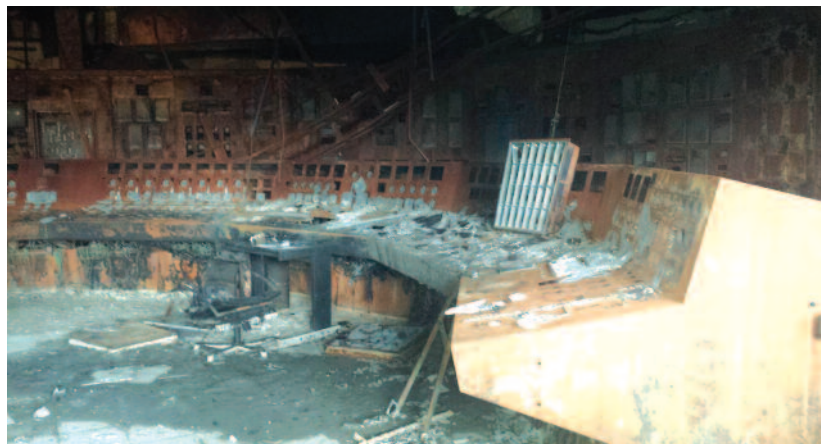
Η αίθουσα κοντρόλ της 4ης μονάδας η οποία καταστράφηκε ολοσχερώς.

Ευτυχώς από την πυρκαγιά δεν υπήρξαν θύματα ούτε τραυματισμοί εκτός από δώδεκα εργαζόμενους που διακομίστηκαν στο νοσοκομείο Πτολεμαΐδας με αναπνευστικά προβλήματα και από αυτούς μόνο ένας χρειάστηκε να παραμείνει για προληπτικούς λόγους καθώς είχε εισέλθει στο κτίριο