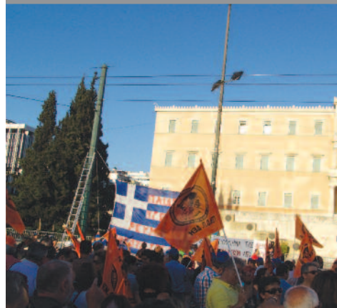
Φωτο συλλαλητηρίου έξω από τη Βουλή Φωτο πορείας εργαζομένων ΜΕΤΡΟ