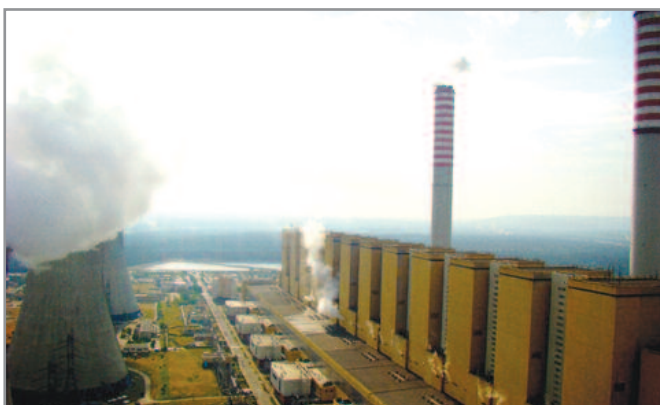
Ο μεγαλύτερος λιγνιτικός σταθμός παραγωγής Η/Ε της Ευρώπης

Η ζήτηση λιγνίτη σε ολόκληρο τον κόσμο αναμένεται να αυξηθεί κατά 5,4% έως το 2020, σύμφωνα με τη Διεθνή Υπηρεσία Ενέργειας.