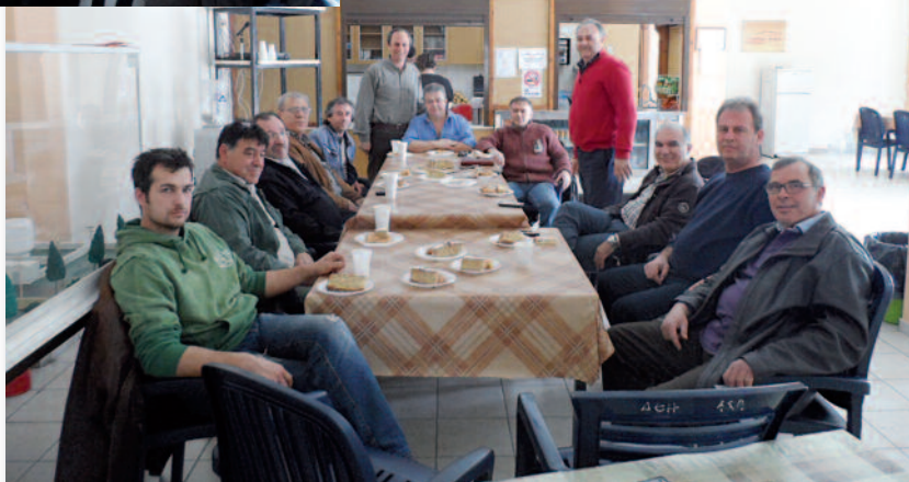
Η συνεδρίαση του Τοπικού Τμήματος στη Μυτιλήνη έγινε στο κυλικείο της Μονάδας (ΑΣΠ Λέσβου).