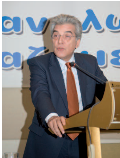
Ο Πρόεδρος και Δ. Σύμβουλος της ΔΕΗ Αρ. Ζερβός.

Μια ενεργειακή επανεκκίνηση αν θέλετε, που χαρακτηρίζεται