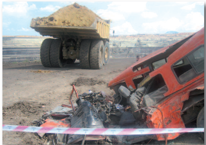
Τα πολλά εργατικά ατυχήματα, ένα θλιβερό προνόμιο των εργαζομένων στον Όμιλο ΔΕΗ, είναι ένας από τους βασικούς λόγους που η επιχείρηση πρέπει να κινηθεί άμεσα για την επίλυση αυτού του βασικού ζητήματος.

Το γεγονός ότι μια επιχείρηση με το μέγεθος και τον κομβικό ρόλο της ΔΕΗ στην εθνική οικονομία δεν έχει ένα πρόγραμμα επιπλέον ασφαλιστικής (υγειονομικής και νοσηλευτικής κάλυψης) του προσωπικού αποτελεί τουλάχιστον «αναχρονισμό» τη στιγμή μάλιστα που επιχειρήσεις μικρότερου μεγέθους έχουν εφαρμόσει ανάλογα προγράμματα. Χαρακτηριστικά, επιχειρήσεις με το ανάλογο ιδιοκτησιακό καθεστώς (συμμετοχή του Δημοσίου και ταυτόχρονα εισηγμένη στο χρηματιστήριο) όπως η ΕΥΔΑΠ αλλά και τα ΕΛΤΑ έχουν αξιοποιήσει –εφαρμόσει ανάλογα προγράμματα εδώ και αρκετά χρόνια στην κατεύθυνση της πρόσθετης παροχής προς τους εργαζομένους τους. Και βέβαια πρέπει να επισημανθεί ότι όλες αυτές οι μεγάλες εταιρίες του ευρύτερου δημόσιου τομέα αλλά και του ιδιωτικού παρέχουν επιπλέον ασφαλιστική κάλυψη στο προσωπικό τους παρά το γεγονός ότι οι εργαζόμενοι σε αυτές δεν αντιμετωπίζουν τις ιδιαιτερότητες και τις εξαιρετικά δυσμενείς συνθήκες εργασίας στον Όμιλο ΔΕΗ.