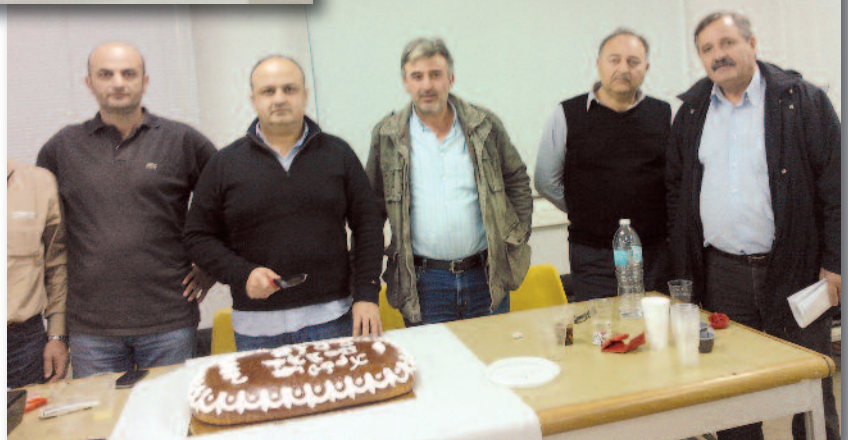
Στις 13 Μαρτίου πραγματοποιήθηκε η συνέλευση του Τοπικού Τμήματος Θεσσαλονίκης, στη Δόξα.