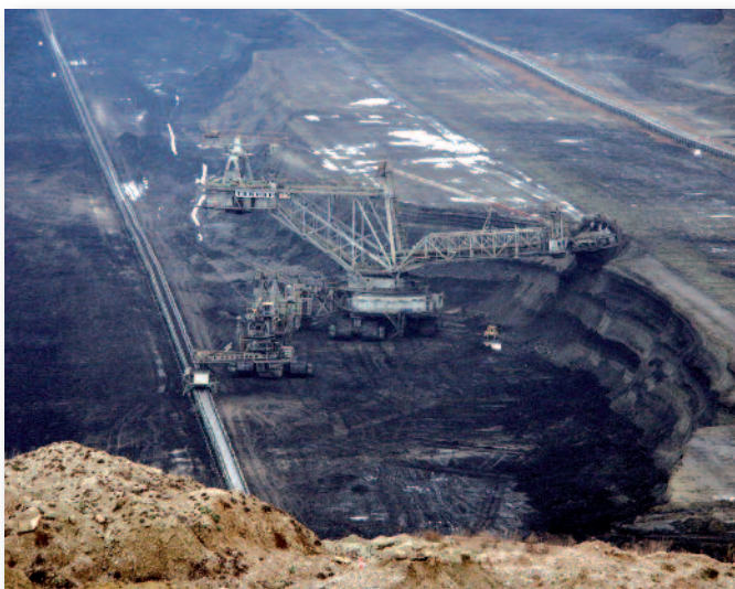
Η ΔΕΗ πληρώνει ήδη "δικαιώματα" με το ειδικό τέλος λιγνίτη που ανέρχεται στο 5% (πέντε τοις χιλίοις) του ετήσιου κύκλου εργασιών της.

Από το σύνολο των λιγνιτικών κοιτασμάτων της χώρας στη ΔΕΗ έχει παραχωρηθεί το αποκλειστικό δικαίωμα εκμετάλλευσης λιγνιτικών κοιτασμάτων, που αντιπροσωπεύουν περίπου το 63% των εκμεταλλεύσιμων λιγνιτικών αποθεμάτων. Ένα μικρό ποσοστό της τάξεως του 5% έχει εκμισθωθεί με μακροχρόνια συμβόλαια σε ιδιώτες και το υπόλοιπο 32% δεν έχει ακόμη παραχωρηθεί ή εκμισθωθεί για εκμετάλλευση.