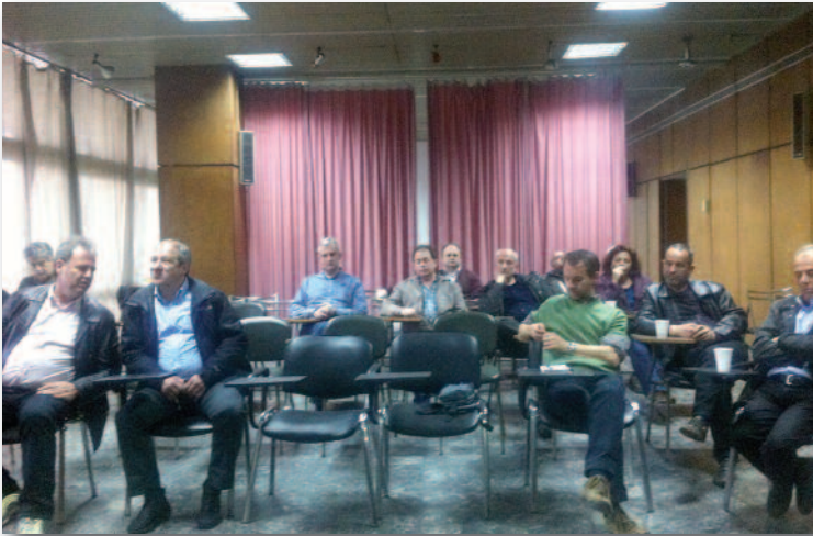
Στην αίθουσα συνεδριάσεων της ΔΠΠΗ στην Πάτρα έγινε η συνεδρίαση του ΤΤ του Συλλόγου μας.