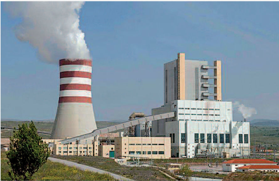
Η Πτολεμαΐδα V θα είναι η πιο σύγχρονη λιγνιτική μονάδα της ΔΕΗ "εκτοπίζοντας" αυτή του ΑΗΣ Μελίτη (φωτο).

Σ χεδόν τέσσερα χρόνια μετά την απόφαση του διοικητικού συμβουλίου της ΔΕΗ (18/5/2009) για την κατασκευή της νέας μονάδας του ΑΗΣ Πτολεμαΐδας, το ίδιο όργανο εξουσιοδότησε στις 11 Δεκεμβρίου 2012 τον Πρόεδρο και Διευθύνοντα Σύμβουλο Αρθούρο Ζερβό να υπογράψει με την εταιρεία ΤΕΡΝΑ Α.Ε. τη σύμβαση για την εκτέλεση του έργου.