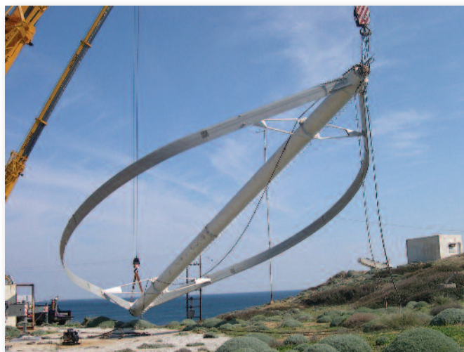
Αποσυαρμολόγηση της Α/Γ καθέτου άξονα στην Ν. Σκύρο.

α) Τόσα χρόνια από τότε, τι έκαναν οι λαλίστατοι κατά τα άλλα, διαφημιστές των εισαγόμενων ανεμογεννητριών, φορείς για την πράσινη ανάπτυξη και αρμόδιοι κρατικοδίητοι πολιτικοί;