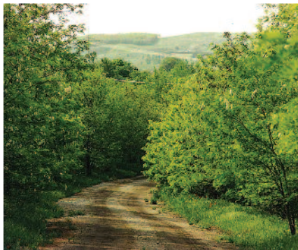
Αποκατάσταση εδαφών στο Λ.Κ.Δ.Μ.

Η μεγάλη αυτή διάκριση είναι το επιστέγασμα των συστηματικών και επίμονων προσπαθειών της Γενικής Διεύθυνσης Παραγωγής για τη βελτίωση της λειτουργίας των Σταθμών Παραγωγής, Θερμικών και Υδροηλεκτρικών τόσο στην Ηπειρωτική Χώρα όσο και στα μη Διασυνδεδεμένα Νησιά. Σ’ αυτή τη δύσκολη για τη χώρα μας οικονομική συγκυρία, καταδεικνύεται ότι η εστίαση στην προστασία του περιβάλλοντος δεν αποτελεί πολυτέλεια, αλλά απόλυτη προτεραιότητα για την κοινωφελή Επιχείρησή μας, που έχει και τη μεγαλύτερη βιομηχανική δραστηριότητα στην Ελλάδα. Για το σκοπό αυτό, η ΔΕΗ πραγματοποιεί τις μεγαλύτερες περιβαλλοντικές επενδύσεις στην Ελλάδα στις υφιστάμενες μονάδες της, ενώ κατασκευάζει νέες υπεσύγχρονες μονάδες ηλεκτροπα-