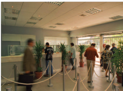
Μέσα σε ένα χρόνο διπλασιάστηκαν οι αιτήσεις καταναλωτών για διακανονισμό

Τον περασμένο Αύγουστο, το πρόβλημα των οφειλών συζητήθηκε σε συνάντηση που είχε με τον υπουργό Οικονομικών Γ. Στουρνάρα ο πρόεδρος της ΔΕΗ Αρθούρος Ζερβός. Πέρα από το προφανές ενδιαφέρον του βασικού μετόχου της ΔΕΗ (υπουργείο Οικονομικών) το ζήτημα των οφειλών του Δημοσίου προς την επιχείρηση δεν είναι αμελητέο. Με βάση τα τελευταία διαθέσιμα στοιχεία τα χρέη των υπουργείων και των οργανισμών του ευρύτερου δημόσιου τομέα ξεπερνούν τα 70 εκατ. ευρώ. Το ποσό βέβαια ήταν μεγαλύτερο στα τέλη του 2012 αλλά η εξόφληση οφειλών για τους φτωχούς σηματοδότες, βελτίω-