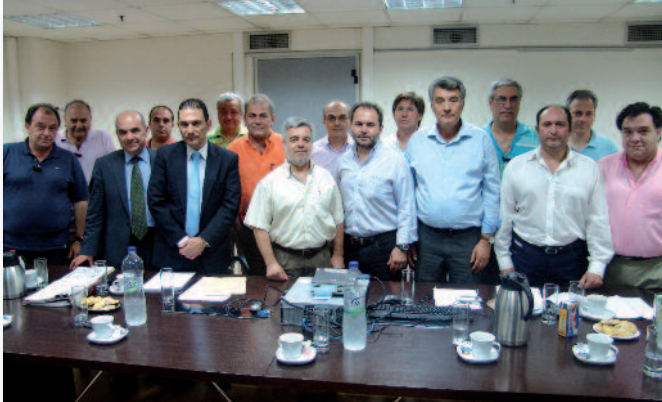
Μέλη των διοικήσεων της ΓΕΝΟΠ/ΔΕΗ και Συλλόγων –μελών με τον Δ. Σύμβουλο του ΑΔΜΗΕ Γ. Βάσσο και στελέχη της Επιχείρησης μετά την υπογραφή της ΣΣΕ.