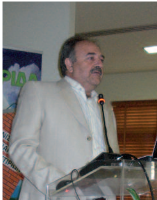
Του Προέδρου του ΣΠΤΜΤΕ/ΔΕΗ Κώστα Βαρσάμη

χώς δεν φαίνεται να είναι η καλύτερη για την Επιχείρησή μας.