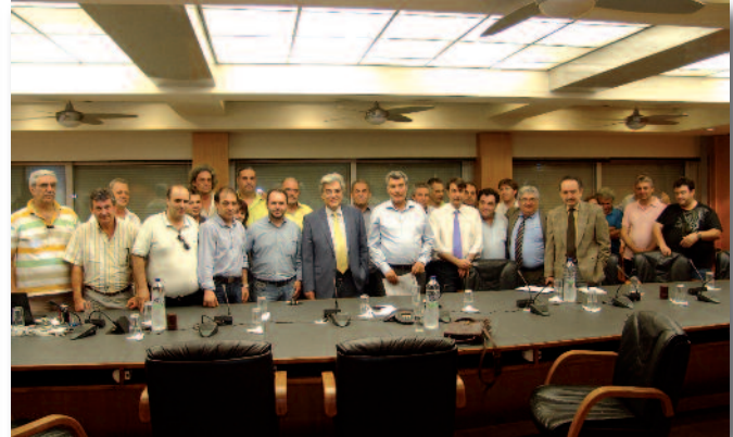
Μέλη των διοικήσεων της ΓΕΝΟΠ/ΔΕΗ και Συλλόγων –μελών με τον πρόεδρο και Δ. Σύμβουλο της ΔΕΗ και στελέχη της Επιχείρησης μετά την υπογραφή της ΣΣΕ.