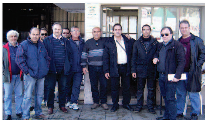
Από την επίσκεψη του μελών του Συλλόγου μας στο εργοστάσιο της Ελληνικής Χαλυβουργίας στον Ασπρόπυργο.

όχι μόνο από ανθρωπιά και συμπάρασταση σε κάτι που συμβαίνει δίπλα μας, αλλά γιατί οι εργάτες της Ελληνικής Χαλυβουργίας αντιμετωπίζουν μια επίθεση που ουσιαστικά στρέφεται εναντίον όλων μας. Η συγκυβέρνηση