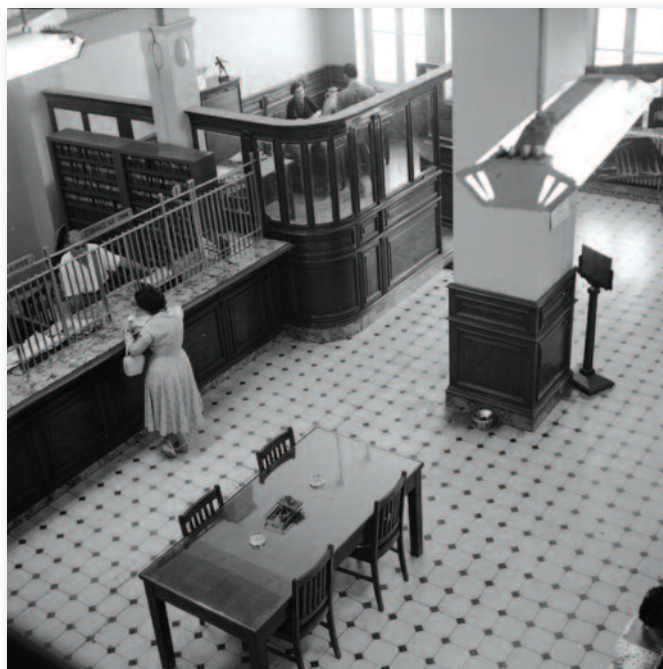
Γραφεία Ηλεκτρικής Εταιρείας Αθηνών-Πειραιώς (ΗΕΑΠ) στην οδό Πειραιώς, 1959

Το ζήτημα του ωραρίου , για το οποίο η διοίκηση Ζερβού επέδειξε μια ανεξήγητη βιασύνη, δημιούργησε μάλλον περισσότερα προβλήματα στο προσωπικό, από τα οφέλη που περιμένουν οι ευφείς σχεδιαστές του.