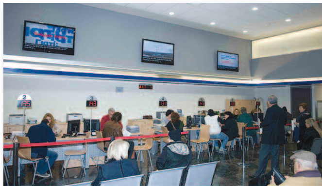
Εξυπηρέτηση πελατών στο κτίριο της ΔΕΗ στην οδό Αριστείδου

Η « παραχώρηση » της Πειθαρχική διαδικασίας της Επιχείρησης, στην δικαιοδοσία του Γενικού Επιθεωρητή Δημόσιας Διοίκησης, τι μπορεί να σημαίνει; Σε τι ωφελεί την επιχείρηση; Οι απαντήσεις μάλλον δεν θα ικανοποιούν κανέναν από αυτούς που πιστεύουν ότι η ΔΕΗ είναι ή πρέπει να είναι μια σύγχρονη επιχείρηση γιατί απλούστατα μετατρέπει την επιχείρηση σε υπηρεσία του δημοσίου της δεκαετίας του '50.