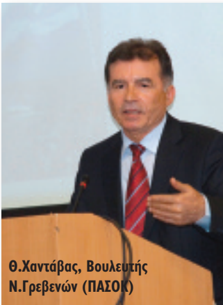
Θ.Χαντάβας, Βουλευτής Ν.Γρεβενών (ΠΑΣΟΚ)

«Είναι ιδιαίτερη χαρά για μένα να είμαι σήμερα εδώ γιατί με πολλούς από εσάς εργάστηκα μαζί για περισσότερα 30 χρόνια. Σήμερα η πατρίδα μας αντιμετωπίζει μια πολύμορφη κρίση και στο χώρο της ενέργειας θα γίνουν μεγάλες αλλαγές στην επόμενη δεκαετία. Πολλοί και στην Ελλάδα και στην Ευρώπη μιλούν για μια νέα βιομηχανική επανάσταση και αυτό γιατί οι συμβατικοί ενεργειακοί πόροι περιορίζο-