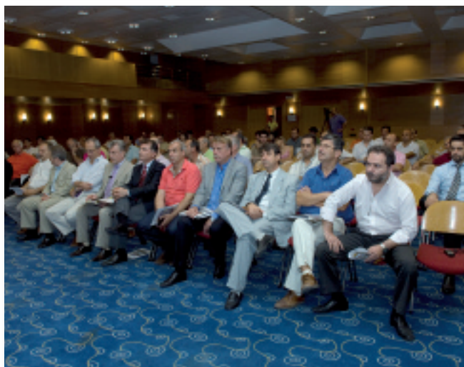
Από τις εργασίες του Γενικού Συμβουλίου του ΣΠΜΤΕ

Την περίοδο 2005-2008 τα κέρδη με τη στρεβλή τιμή έγιναν στάχτη ; γιατί από ότι φάνηκε τίποτα δεν επενδύθηκε στη χώρα.