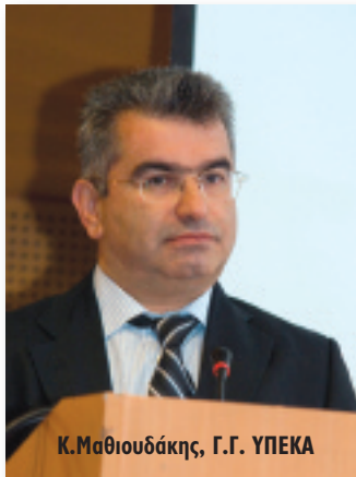
Κ.Μαθιουδάκης, Γ.Γ. ΥΠΕΚΑ

Ήταν το σχέδιο δράσης για την ανάπτυξη των ΑΠΕ, το οποίο παρουσίασε όχι μόνο τις ανανεώσιμες πηγές αλλά το σύνολο του μίγματος που χρησιμοποιεί για να φτάσουμε τους στόχους του 2020, όπως έχει υποχρέωση η χώρα μας. Αναφέρομαι στον ενεργειακό σχεδιασμό για τη ΔΕΗ, τη μεγαλύτερη επιχείρηση της χώρας, την πιο κρίσιμη επιχείρηση της χώρας, την επιχείρηση που βρίσκεται