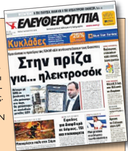
Το πρωτοσέλιδο της Ελευθεροτυπίας