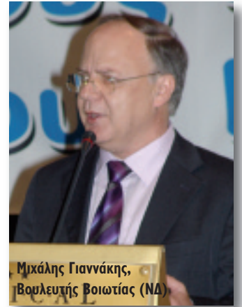
Μιχάλης Γιαννάκης, Βουλευτής Βοιωτίας (ΝΔ)

δεκαετίες τώρα. Θέλουμε μια ΔΕΗ αναπτυσσόμενη, όχι φοβική στον ανταγωνισμό. Νομίζω ότι και εσείς οι εργαζόμενοι δεν έχετε να φοβηθείτε τον ανταγωνισμό, αν αυτός είναι σε σωστές βάσεις, σε σταθερούς κανόνες που τηρούνται από όλες τις πλευρές. Εσείς έχετε ένα πλεονέκτημα. Την τεχνογνωσία δεκαετιών που δεν την έχει ο ανταγωνισμός, που εκεί μπορεί να κάνετε καλύτερα βήματα.»