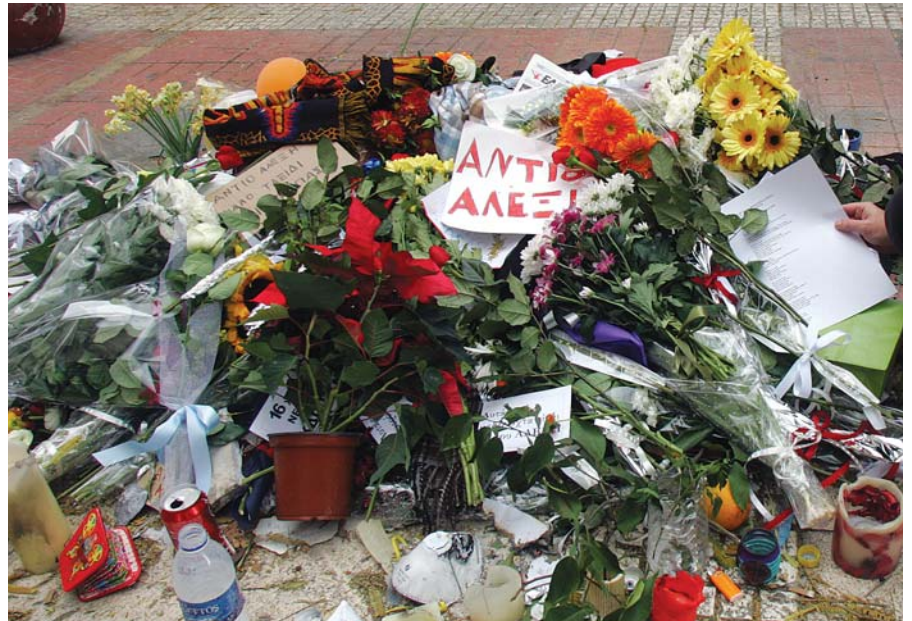
Τόπος προσκληνύματος έγινε το σημείο, Μεσολογγίου & Τζαβέλα στα Εξάρχεια, που δολοφονήθηκε ο 15χρονος Αλέξανδρος Γρηγορόπουλος.

Θέλοντας να αναλύσουμε την κατάσταση που υπάρχει αυτή τη στιγμή θα πρέπει να σταθούμε στην έναρξη της σχολικής «περιπέτειας» ξεκινώντας τα παιδιά από το νηπιαγωγείο. Μετά από απόφαση εξπρές της τότε υπουργού παιδείας κ. ΓΙΑΝΝΑΚΟΥ για ένταξη των νηπιαγωγείων στην υποχρεωτική εκπαίδευση, παρατηρήθηκε ότι μεγάλος αριθμός παιδιών δεν μπορούσαν να εγγραφούν στα δημόσια σχολεία, γιατί δεν υπήρχε η