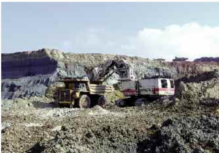
Μειωμένη ήταν η παραγωγή ηλεκτρικής ενέργειας από λιγνίτη τους εννέα πρώτους μήνες του 2010 "κατά 2.140 GWh έναντι του εννεαμήνου 2009", σύμφωνα με τη ΔΕΗ.

Πέρα όμως από τη μείωση των πωλήσεων στη λιανική αγορά, αυτό που αποτελεί σημαντική εξέλιξη είναι η υποχώρηση του ποσοστού της συνολικής ζήτησης που καλύπτει η επιχείρηση. Έτσι, η παραγωγή της ΔΕΗ, μαζί με τις ποσότητες ηλεκτρικής ενέργειας που εισήγαγε, κάλυψε το 77,8% της συνολικής ζήτησης ενώ το αντίστοιχο ποσοστό το εννεάμηνο του 2009 ήταν 85,9%. Τα αντίστοιχα ποσοστά στο Διασυνδεδεμένο Σύστημα, που είναι εκτεθειμένο στον ανταγωνισμό, είναι 76,5%